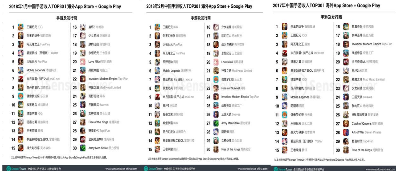
圖 1：LM 收入排名走高